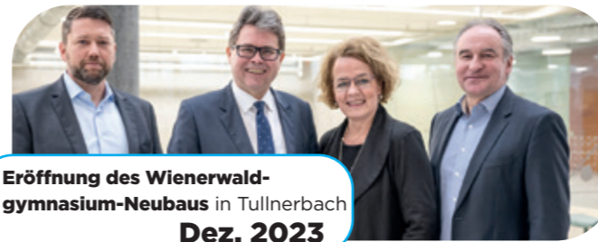
Eröffnung des Wienerwald-gymnasium-Neubaus in Tullnerbach Dez. 2023