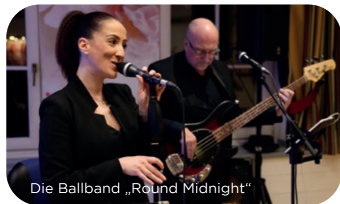
Die Ballband „Round Midnight“

Über 200 tanzfreudige Gäste fanden sich im wunderschön dekorierten Wienerwaldhof ein. Damit war der Ball ausverkauft und unsere Gästeschar freute sich über die vielen Höhepunkte, die dieser Ball zu bieten hatte.