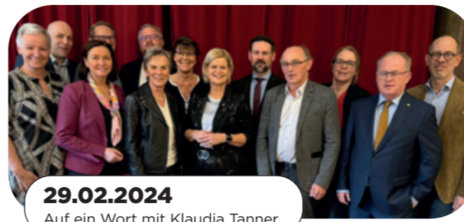
29.02.2024 Auf ein Wort mit Klaudia Tanner