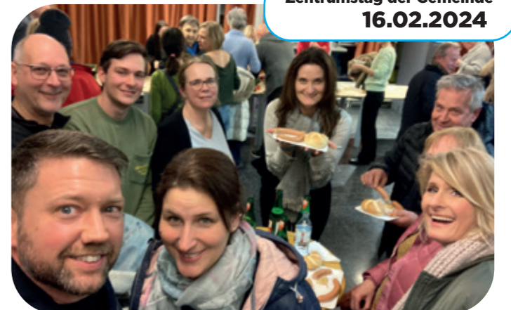
Zentrumstag der Gemeinde 16.02.2024