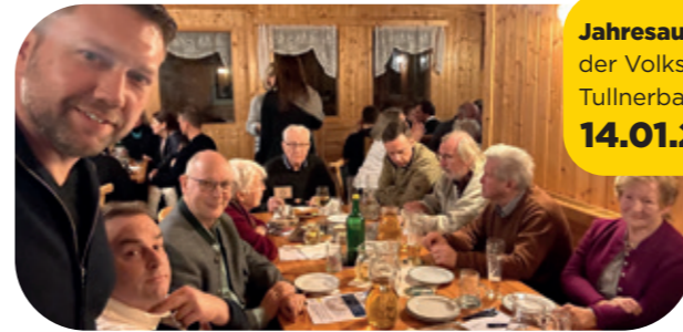
Jahresauftakt der Volkspartei Tullnerbach 14.01.2024