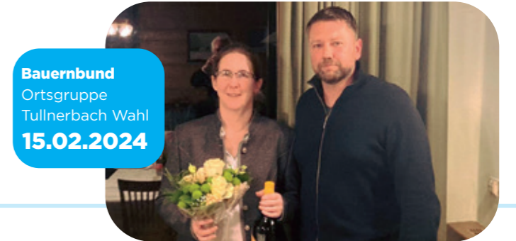
Bauernbund Ortsgruppe Tullnerbach Wahl 15.02.2024