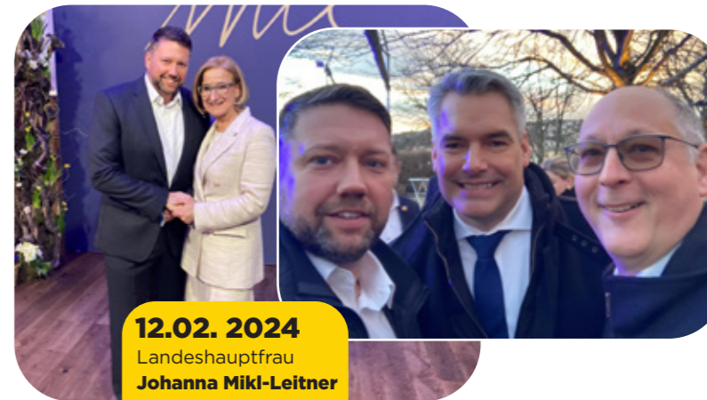
12.02.2024 Landeshauptfrau Johanna Mikl-Leitner 60.Geburtstag