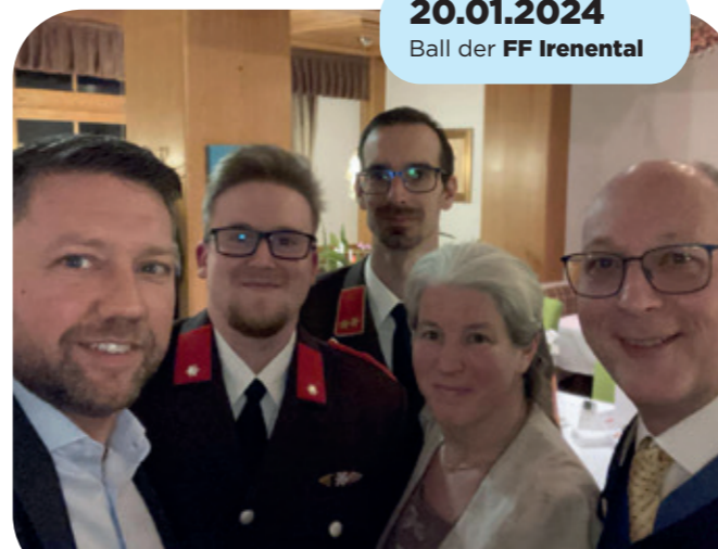
20.01.2024 Ball der FF Irenental