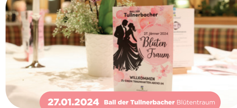
27.01.2024 Ball der Tullnerbacher Blütenraum