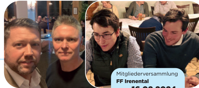
Mitgliederversammlung FF Irenental 16.02.2024

Wir leben Gemeinschaft - Zusammenleben steht für Erlebnisse, die uns zusammenbringen und unsere Verbundenheit stärken. Hier finden Sie die Höhepunkte der letzten Wochen!